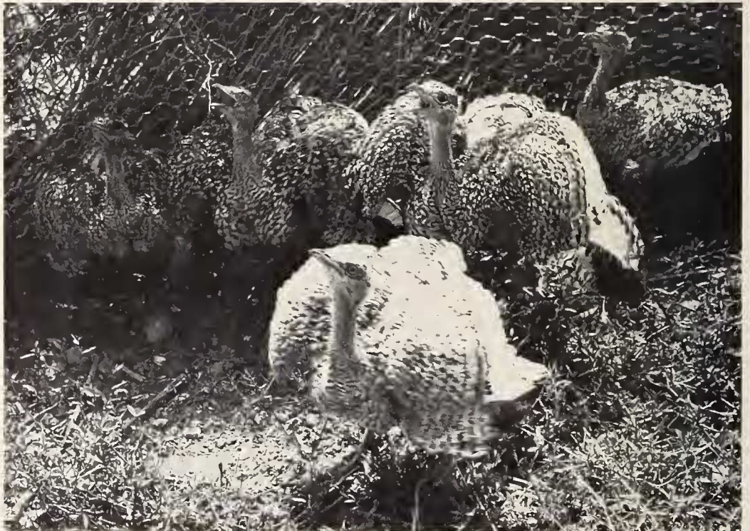
Abb. 8: Junge Zwergtrappen drohen gegen Luftfeind.